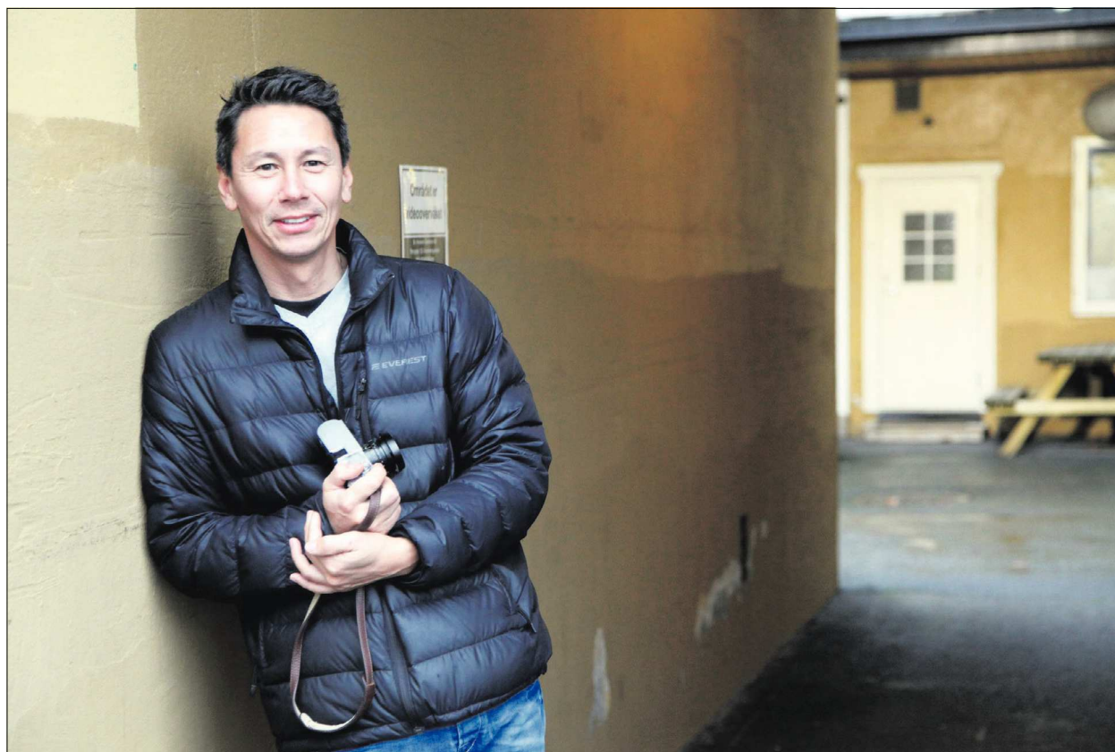
RYKKER IKKE LENGER: - Sirener får det ikke til å rykke i foten lenger, sier fotograf Danny Twang. Han jobba drøye 15 år i Porsgrunns Dagblad.