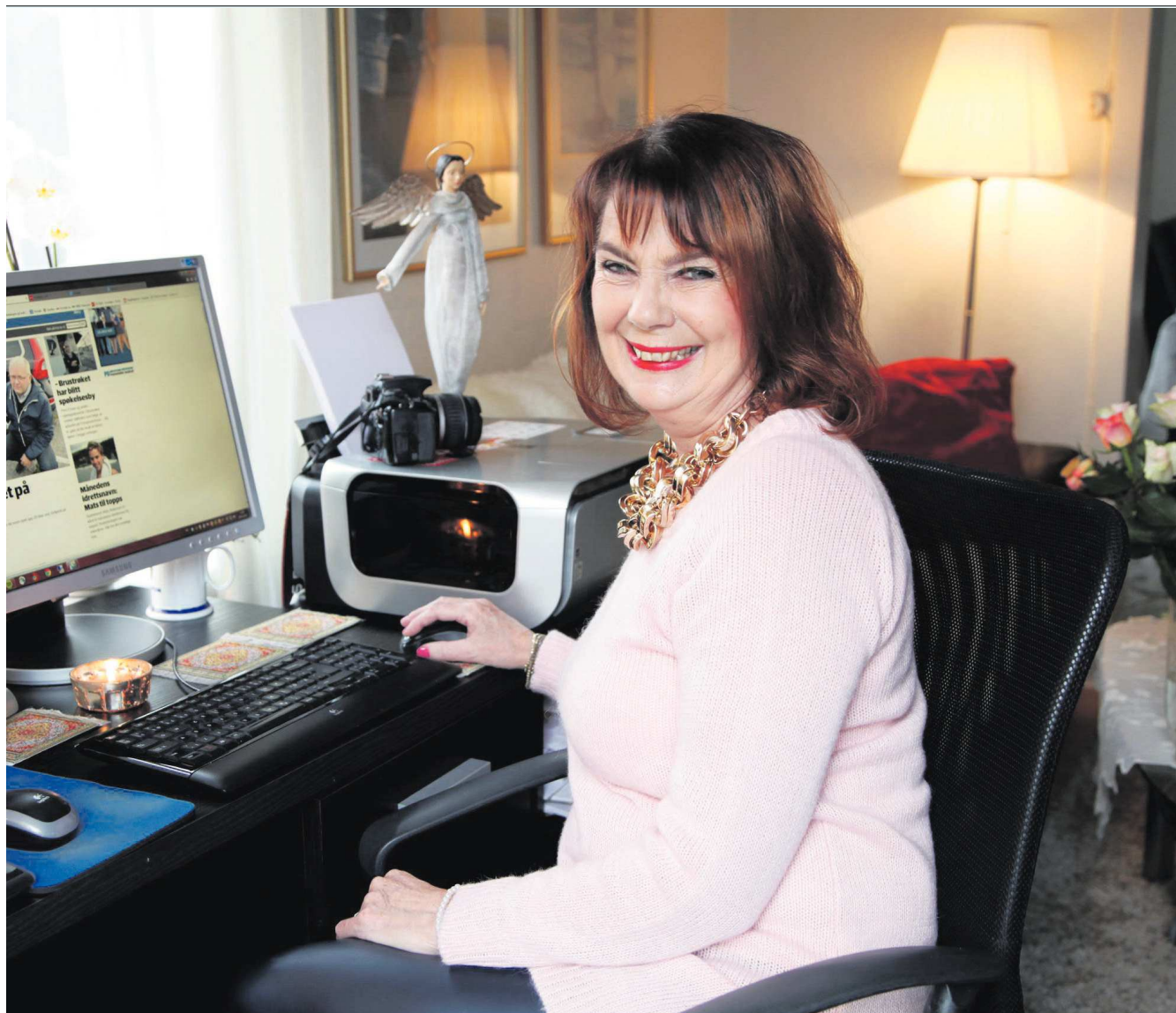
tilbake som journalist i Porsgrunns Dagblad. – Da jeg overtok Breviksposten, bestemte jeg meg for å erobre Brevik med hud og hår, forteller journalisten.

skjermen. Først som distriktets representant i Dagsrevyen og Sportsrevyen. Deretter tok hun over som programleder i Norge Rundt og fungerte som løpende reporter i Vikingskipet under OL i '94.