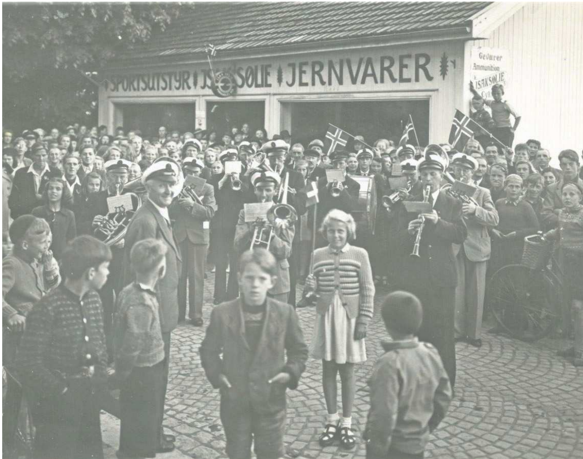
KORPS OG JUBELROP: Mannskapet på «Sine» ble hyllet av folk i Porsgrunn. Kjenner du igjen noen på bildet? Ta kontakt med PD's journalist.