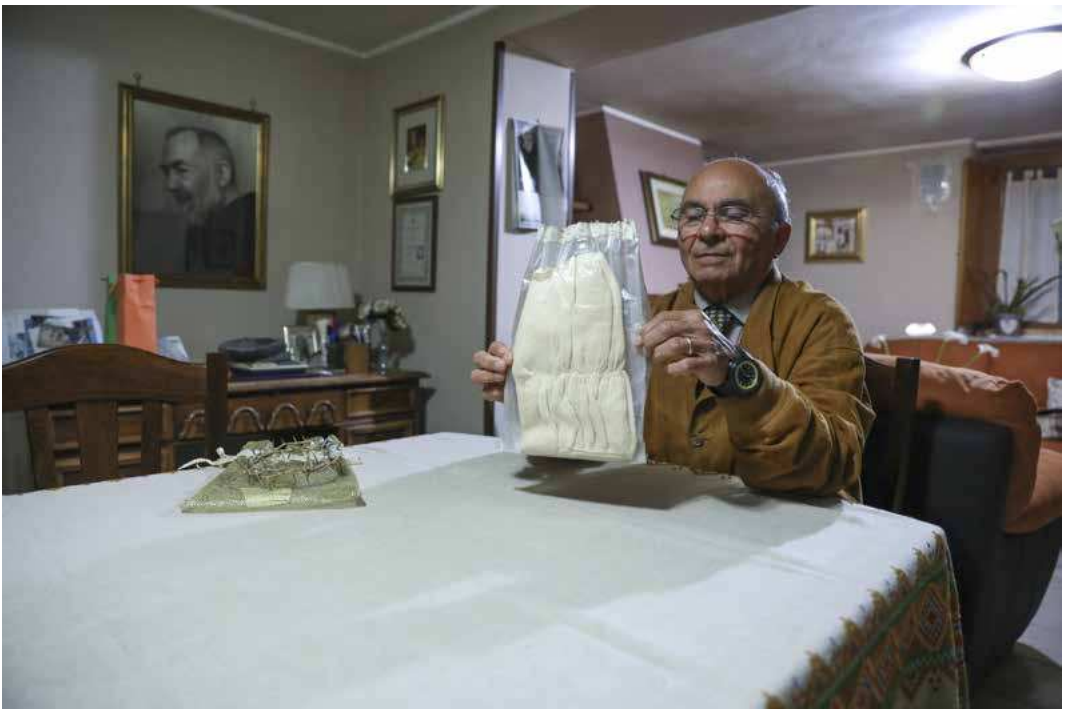
Pio ladanza med relikvie etter Padre Pio.