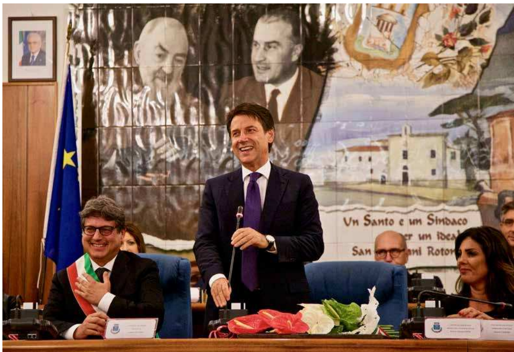
Statsminister Giuseppe Conte er en trofast tilhenger av Padre Pio og bærer med seg et bilde av mirakelmunken på innerlomma av dressjakka. En praksis som antagelig er ganske langt unna norsk politikervirkelighet.