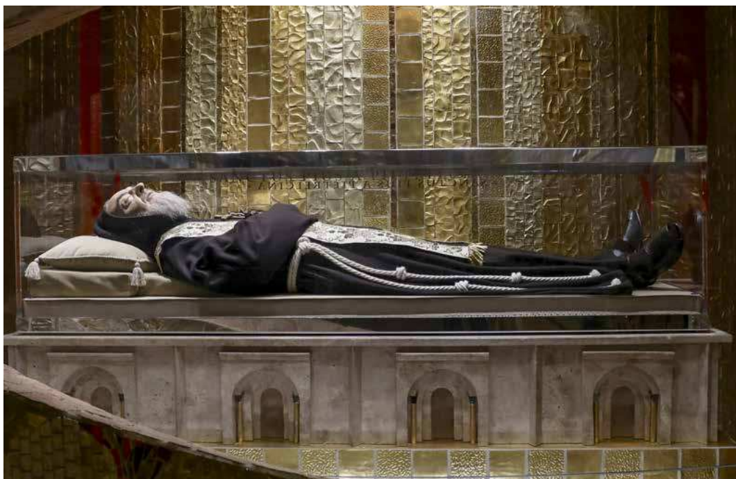
Levningene etter Padre Pio i krypten til pilegrimskirken i San Giovanni Rotondo.