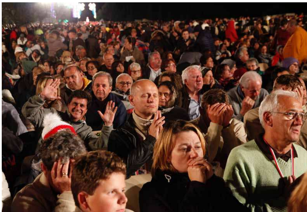
Plassen foran Padre Pios pilegrimskirke i San Giovanni Rotondo under messen 23. september 2018.